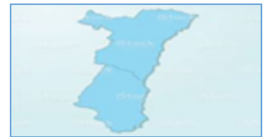
Bassin Universitaire Strasbourg